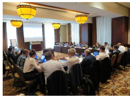
ISO/TC131 サンアントニオ会議風景