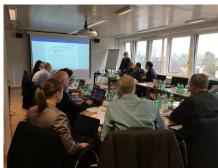
ISO/TC131 ヴィンタートゥール会議風景