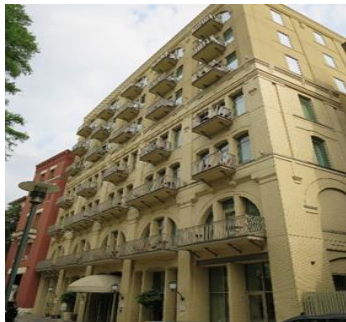
ISO/TC131 サンアントニオ会議場

また、発行されたISO審議文書116件についてすべて回答し、日本の意見の反映に努めた。