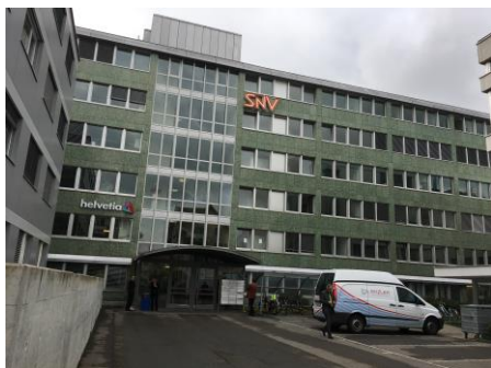
ISO/TC131 ヴィンタートゥール会議場